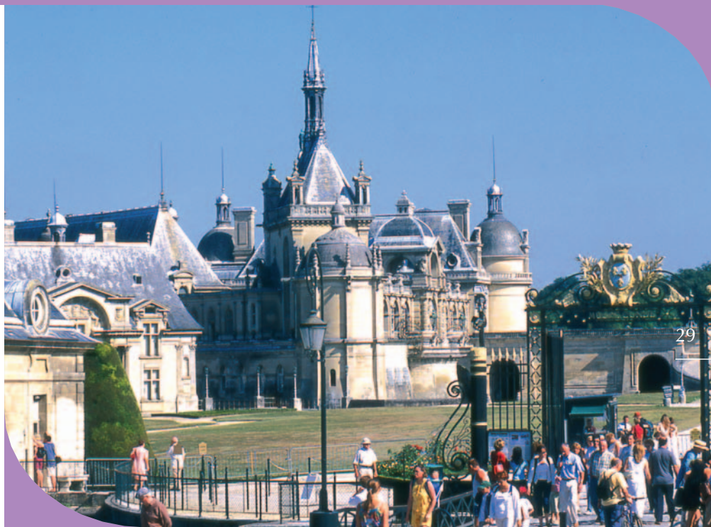
Musée Condé - Château de Chantilly - Oise