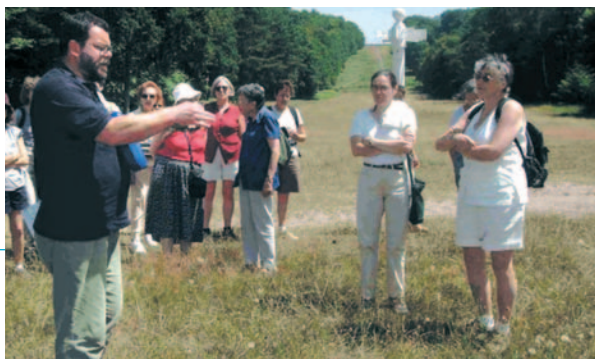
Festival des Forêts - Oise