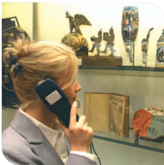
L'audioguide (trilingue) - Historial de la Grande Guerre - Péronne - Somme