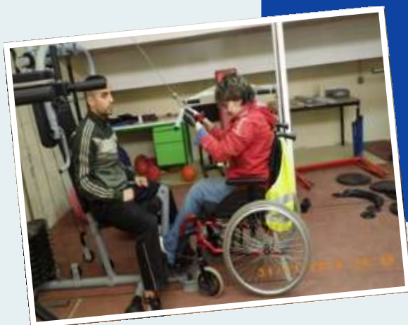
Pôle Ressources National Sport et Handicaps

Le club possède du matériel pédagogique permettant au public en situation de handicap de pratiquer en toute sécurité (exemple : poids pour le lancer en mousse, javelot en mousse, marteau adapté en plastique, médecine-ball adapté, etc.). Pour accueillir les personnes handicapées dans les meilleures conditions et développer les pratiques compétitives et de loisirs, l'association souhaite investir dans l'achat de handbikes et de joëlettes et du matériel de musculation spécifique puisque les appareils ne sont actuellement pas tous adaptés.