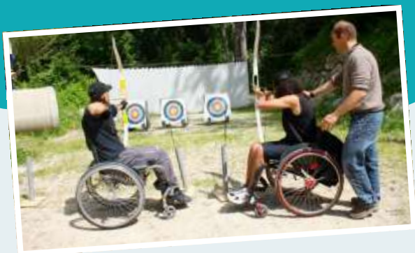
Pôle Ressources National Sport et Handicaps

Pour assurer la sécurité, le nombre de participants par activité est compris entre 8 et 15 personnes encadrées pour un moniteur diplômé d'Etat (renforcé si nécessaire par un encadrant supplémentaire).