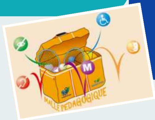
Pôle Ressources National Sport et Handicaps

L'office municipal du sport (OMS) a également organisé une formation de sensibilisation au handicap afin de développer et d'améliorer l'accueil des sportifs handicapés dans les clubs.