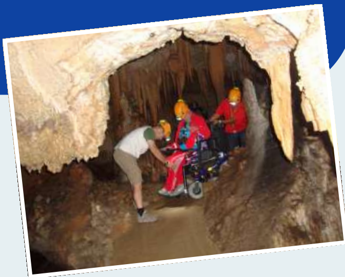
Pôle Ressources National Sport et Handicaps

Par ailleurs, le projet représente également une opportunité de développement touristique pour le territoire grâce à la candidature du canton de Ganges à la labellisation « Destination pour tous » attribuée par le Ministère du Développement Durable pour récompenser les territoires proposant une offre attrayante de loisirs et d'hébergement accessible aux personnes handicapées.