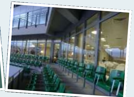
Le stade Geoffroy Guichard