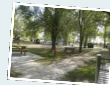
Base de loisirs des Etangs